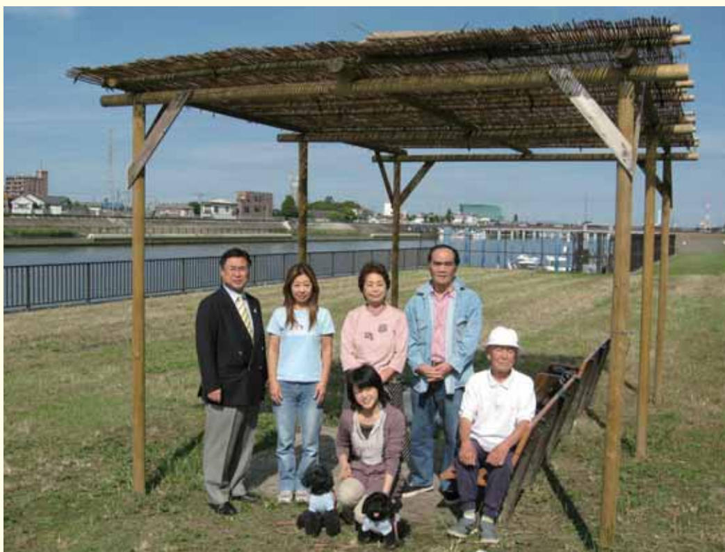
(春江町3丁目の皆さんと川瀬区議)

このほど、新中川左岸（春江町側）の南橋橋北側付近の河川敷に「日よけとベンチ」が設置されました。この場所には多くの区民の皆さんが、犬といっしょに散歩したり、ウォーキングや釣りなどを楽しんでいます。