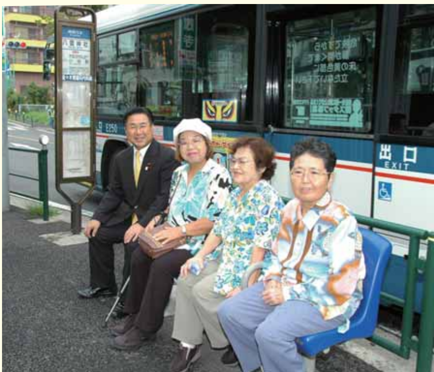
(江戸川3丁目の皆さんと川瀬区議)

「バスを待つ時間は、長くなることもあるのでベンチを是非つけてほしい」という要望があり区の土木部と東京都第5建設事務所と協議し設置しました。