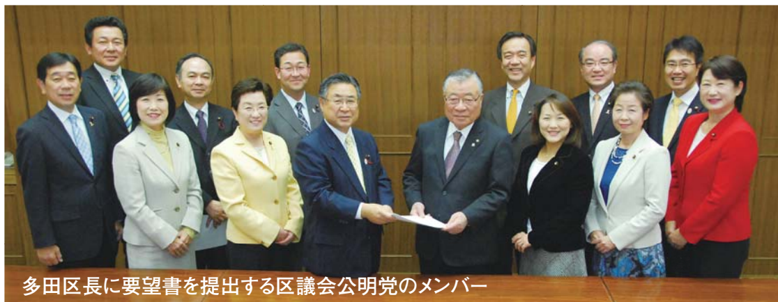
多田区長に要望書を提出する区議会公明党のメンバー