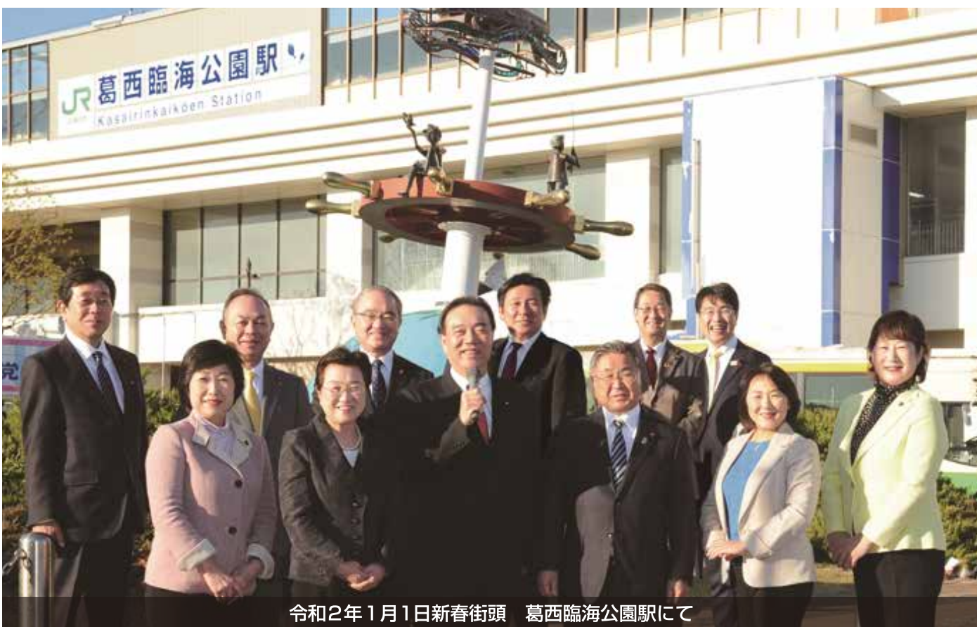
令和2年1月1日新春街頭 葛西臨海公園駅にて

江戸川区議会公明党12名は令和2年1月1日にJR葛西臨海公園駅にて、令和2年の幕開けとなる新春街頭演説会を行いました。 本年7月には、いよいよ東京オリンピック・パラリンピック競技大会が開催され、本区ではカヌー・スラローム競技が行われます。 豊かな共生社会を目指し、区民ニーズにお応え出来るよう本年も全力で働いてまいります!