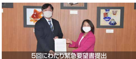
5回にわたり緊急要望書提出