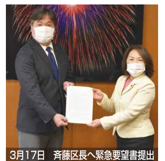
3月17日 斉藤区長へ緊急要望書提出

若い女性が経済的に困窮し、生理用品に困っている実態を受けて区に緊急要望。東京都の防災備蓄物資の支給に区独自で上乗せして、計880袋を希望する方に区内3か所と区内7館の共有プラザで配布。また、困窮家庭には食料品と合わせて配布を行いました!