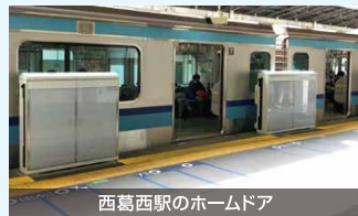
西葛西駅のホームドア