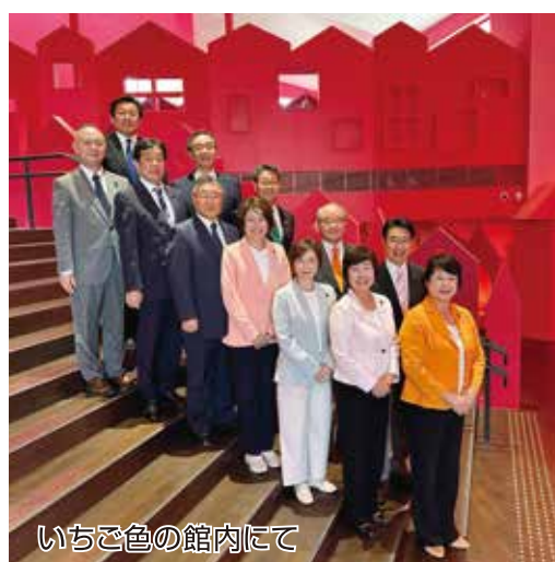
いちご色の館内にて

『魔法の宅急便』の作者で、江戸川区ゆかりの児童文学作家・角野栄子さんの作品の世界観をイメージした、大好きな本に出合える「魔法の文学館」(江戸川区角野栄子児童文学館)が、本年11月3日(金)に「なぎさ公園内(南葛西7-3-1)」に開館しました。区議会公明党は当初より文学館建設を推進してきました。