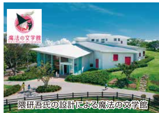
隈研吾氏の設計による魔法の文学館