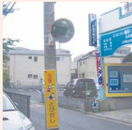
▲松江にカーブミラーが設置されました。