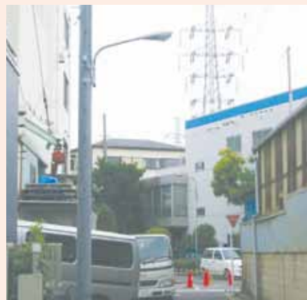
▲松江に新しく街路灯が設置されました。