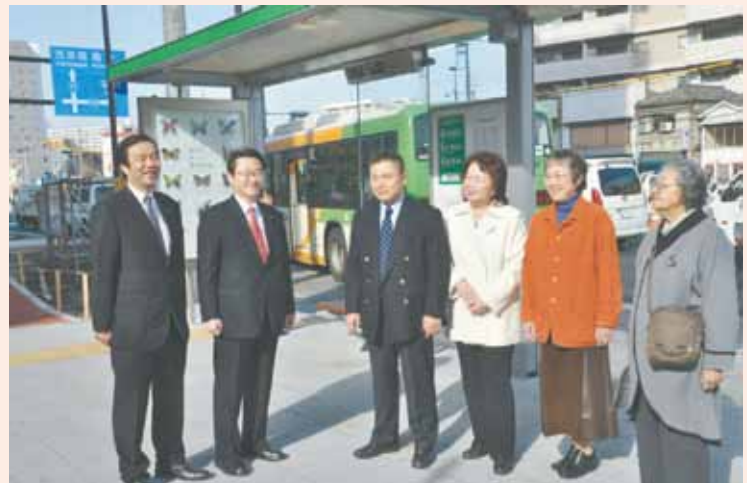
▲小松川3丁目バス停の屋根が新設されました。