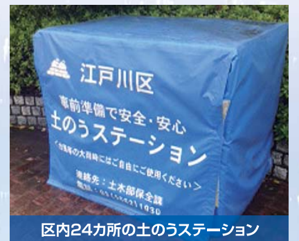
区内24カ所の土のうステーション

10月15日、16日の台風26号は本区においても、東部地域で最大時間雨量が63mmとなり、一部地域では床上、床下浸水の被害も発生した。被害の大きかった地域については、状況をしっかりと把握して今後の対策について区と協議していきたい。