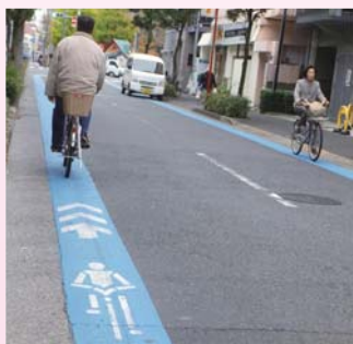
ブルーレーンと自転車ナビマーク

A 今年度は船堀駅周辺、来年度以降は一之江駅周辺等の整備を検討している。今後も交通管理者と協力し、駅周辺を中心に整備を進めていく。自転車は車道左側端通行が原則だが、交通量が多い幹線道路については、歩行者・自転車利用者双方が安全・安心に通行できるよう交通管理者と研究していく。