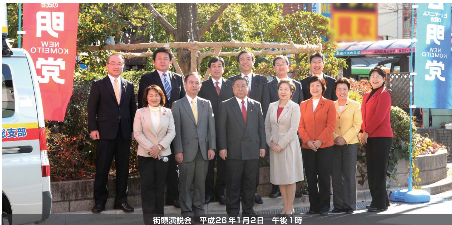
街頭演説会 平成26年1月2日 午後1時

JR小岩駅南口にて江戸川区議会公明党13名全員で本年のスタートをいたしました。瑞江、船堀、西葛西、平井、新小岩駅でも街頭を実施。