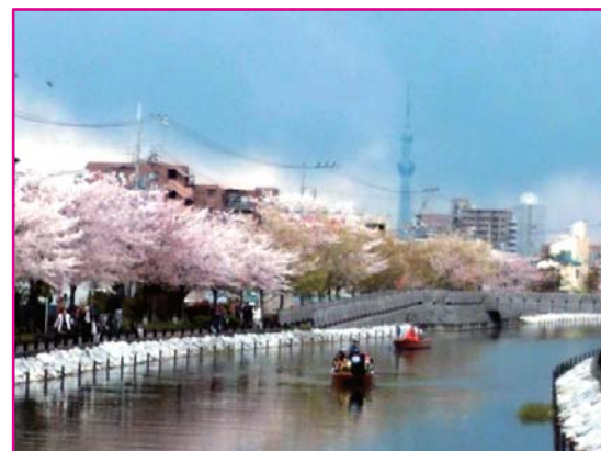
遠くスカイツリーも見え、新川のさくらと和船