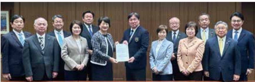
齊藤区長に要望書を提出する江戸川区議会公明党 (2026.4.2)

本年も早い時期から猛暑が心配される事から、右記の2点を早急に検討・実施するよう要望しました。