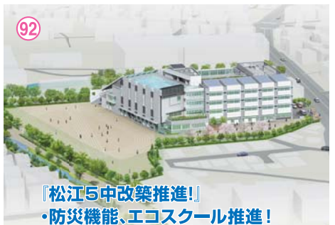
「松江5中改築推進！」 ・防災機能、エコスクール推進！