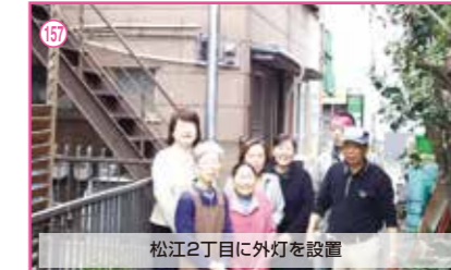
157 松江2丁目に外灯を設置