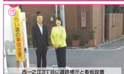
175 西一之江3丁目に道路標示と看板設置