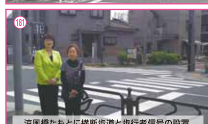
181 涼風橋たもとに横断歩道と歩行者信号の設置