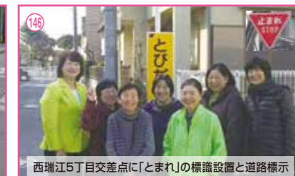
146 西瑞江5丁目交差点に「とまれ」の標識設置と道路標示