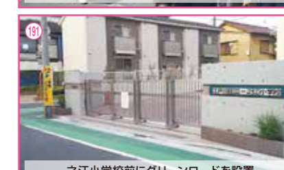
191 一之江小学校前にグリーンロードを設置