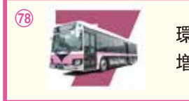
78 環七シャトル・セブンの増便とバス停の整備!