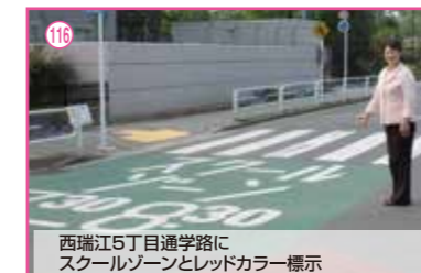
116 西瑞江5丁目通学路にスクールゾーンとレッドカラー標示