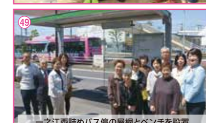
49 一之江西詰めバス停の屋根とベンチを設置