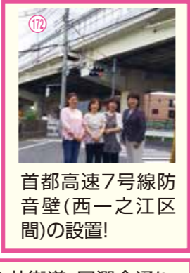
172 首都高速7号線防音壁(西一之江区間)の設置!