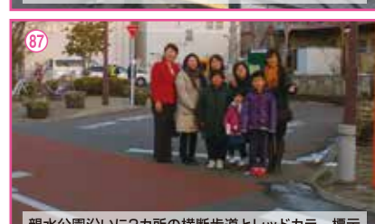
87 親水公園沿いに2カ所の横断歩道とレッドカラー標示