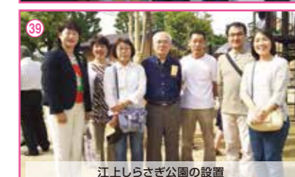
39 江上しらす公園の設置