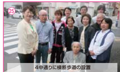
25 4中通りに横断歩道の設置