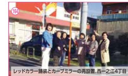
164 レッドカラー舗装とカーブミラーの再設置。西一之江4丁目