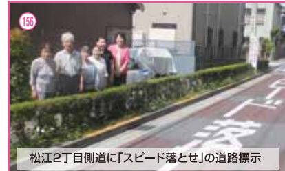
156 松江2丁目側道に「スピード落とせ」の道路標示