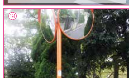
124 二之江さくら公園脇にカーブミラーを設置