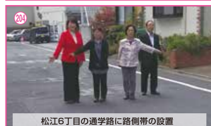
204 松江6丁目の通学路に路側帯の設置