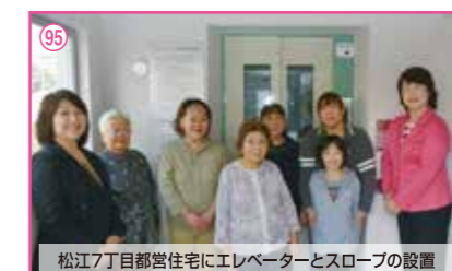
95 松江7丁目都営住宅にエレベーターとスロープの設置