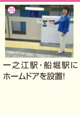
210 一之江駅・船堀駅にホームドアを設置!