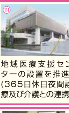
114 地域医療支援センターの設置を推進! (365日休日夜間診療及び介護との連携)