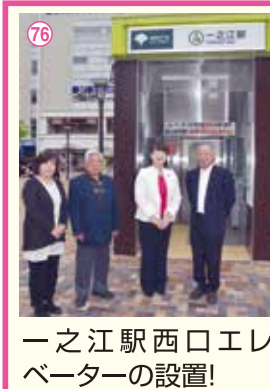
76 一之江駅西口エレベーターの設置!