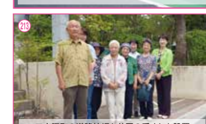
213 二之江町の道路拡幅と公園の手すりを設置